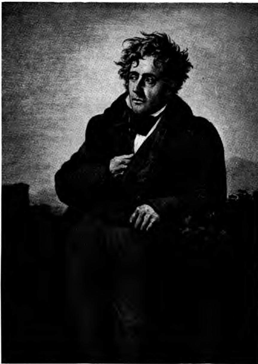
PORTRAIT DE CHATEAUBRIAND